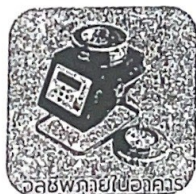
อัลตราซาวด์ (ไซอาคาร)